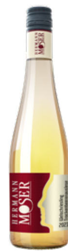
Weingut Hermann Moser 2023 Welschriesling Die kleine Süße TBA