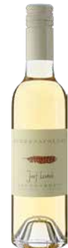
Weingut zur Dankbarkeit 2021 Welschriesling Beerenauslese