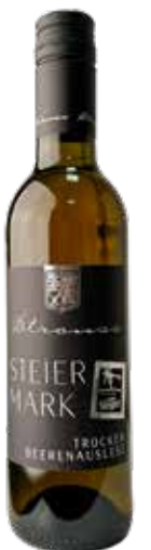
Weingut Karl & Gustav Strauss 2022 Welschriesling & Traminer TBA