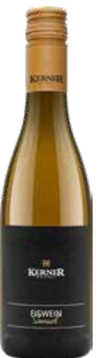
Weingut Kerner 2023 Grüner Veltliner Samuel Eiswein